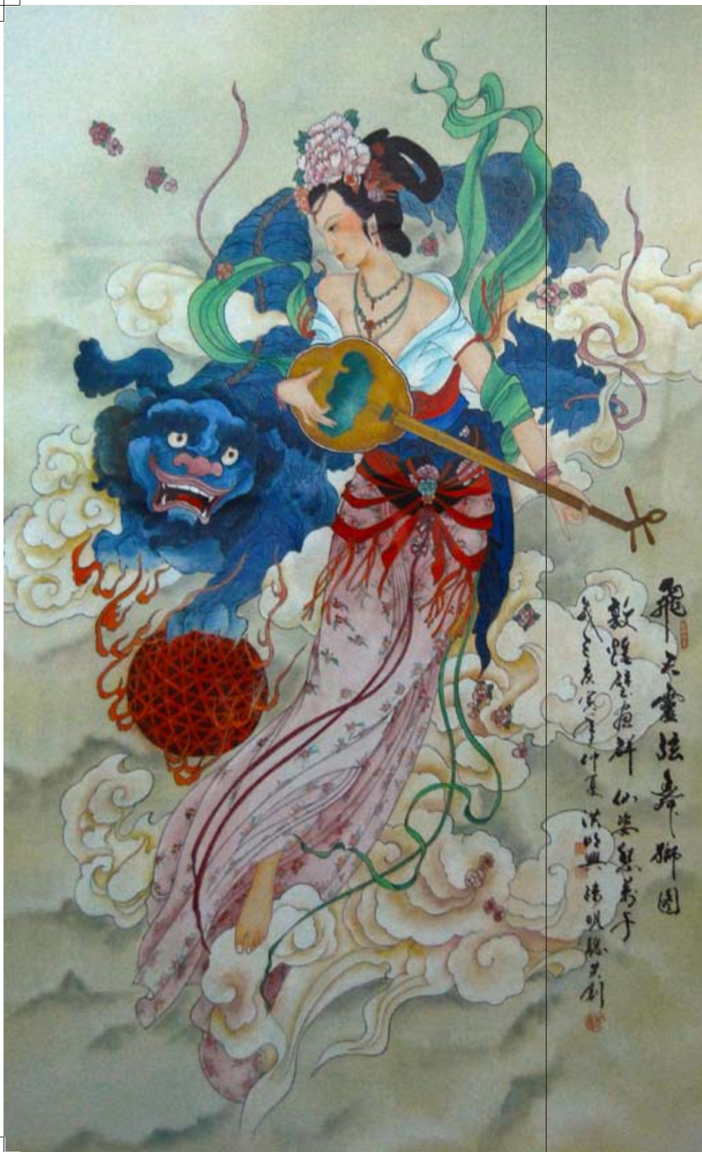
飛天舞獅 洪○興 陳○聰 135×77 cm